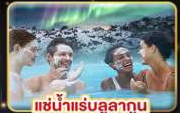
แช่น้ำแร่สุขภาพ