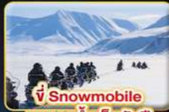
ขี่ Snowmobile บนธารน้ำแข็งพันปี